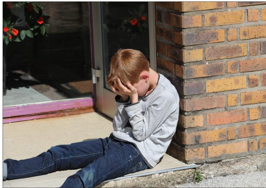
■ Attention aux formes de violence institutionnelle...

► Un supplément spécial « Orientation Post 3 e » : à découvrir dimanche avec les éditions de L'Est Républicain et de Vosges Matin.