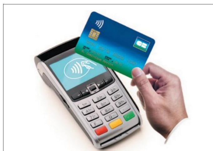
■ Pas obligé de l'accepter...

Il s'agit d'une « puce » appelée NFC. Celle-ci peut permettre de payer à distance sans frappe de code. Il s'agit d'un paiement électronique voisin du WiFi en Internet. Cette novation n'a pas fait l'objet de beaucoup de publicité de la part des banques qui l'installent sur toutes les cartes depuis plusieurs années. Nous vous conseillons de prendre contact avec votre banque pour lui demander quelles sont les conditions d'utilisation, les garanties en cas de problèmes car on peut retirer jusqu'à 80 € et surtout les nouvelles conditions géné-